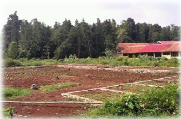
Foto saat pembangunan terhenti, 2013

Tanggal 4 Agustus 2020 tersedia dana hasil penjualan aset Yatub di Jl. Arga Lamongan C4/10 Perumahan Arga Bajapura Cilegon, maka pembangunan Asrama dilanjutkan.